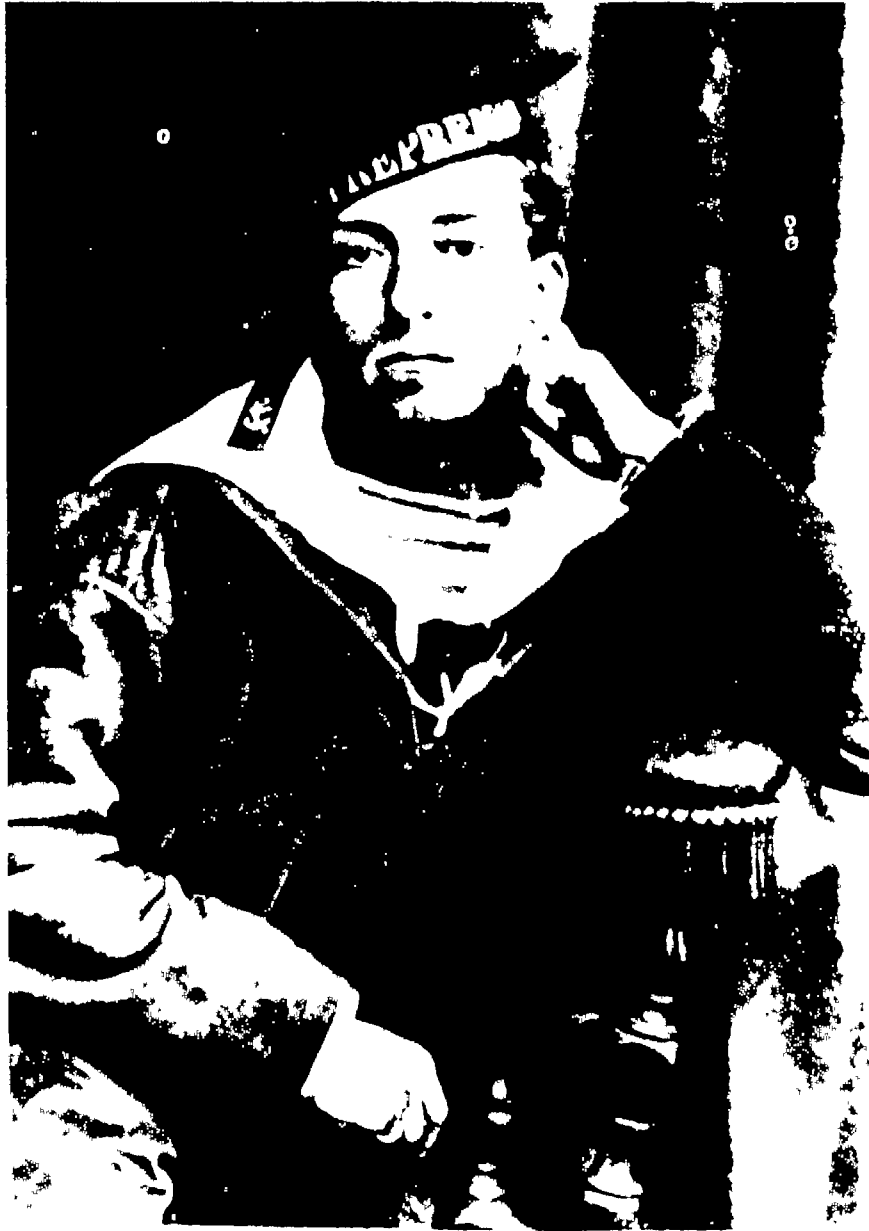
بيير لوتي صايط في البحرية